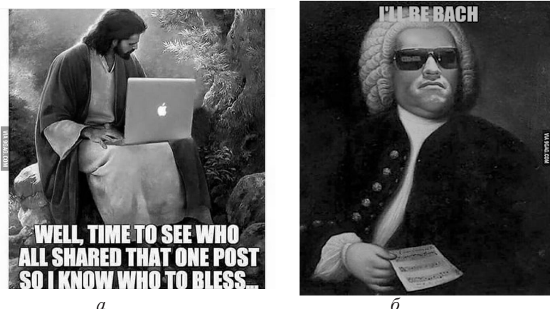
Рис. 3. Англоязычные интернет-мемы, репрезентирующие гротескное взаимодействие временных планов 3