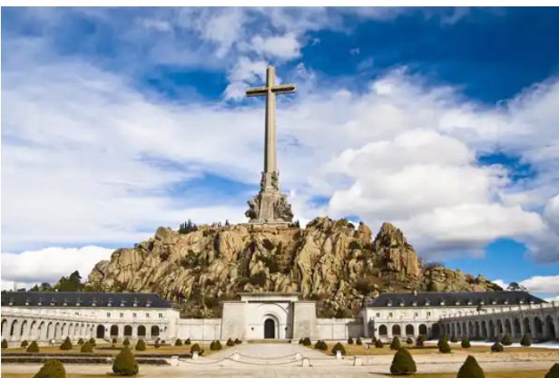
Рис. 2. Долина Павших в Испании

Fig. 1. The last monument to Francisco Franco in Spain being torn down