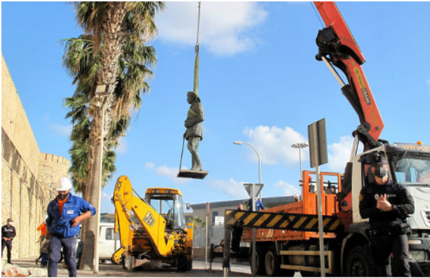
Рис. 1. Снос последнего в Испании памятника Франсиско Франко

Fig. 1. The last monument to Francisco Franco in Spain being torn down